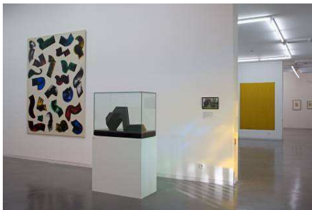
Vue d'une salle du musée

Les espaces d'exposition présentent de grands volumes qui alternent salles plafonnées plus intimes et salles où les poutres restent apparentes. Le visiteur circule librement dans des espaces lumineux et rythmés, loin de l'aseptisation du « white cube ».