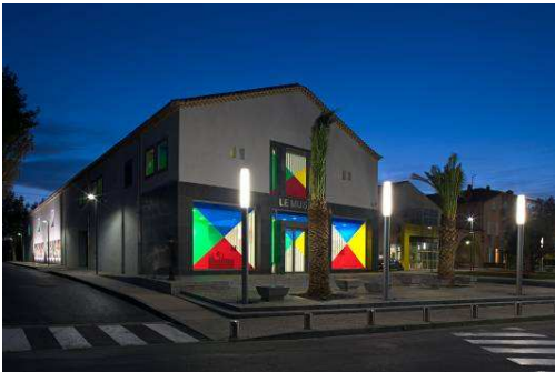
le musée de sérignan, Anne Gaubert et François Moget architectes, Photo: J-P. Planchon