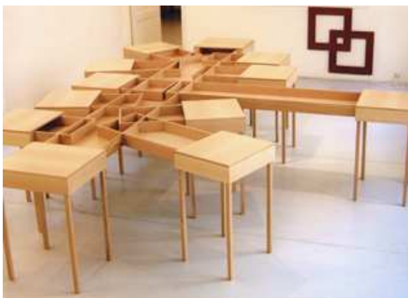
Nathalie Elémento, Le grand Banquet , 2000, collection du FNAC