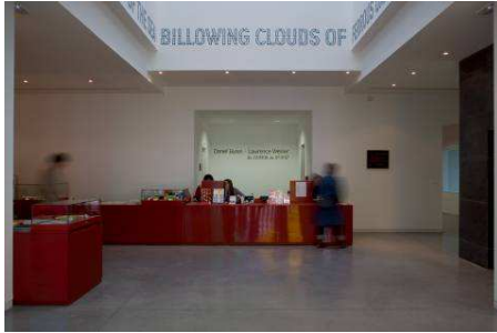
Espace d'accueil, Librairie – boutique, Projectiles