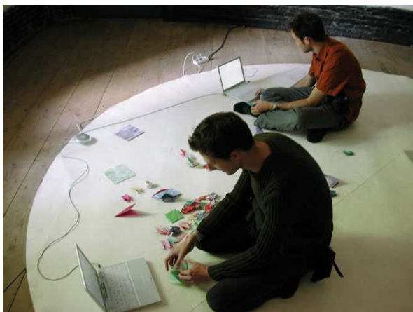
Marie-Ange Guilleminot, Le Salon de transformation blanc , 1999, collection du FNAC